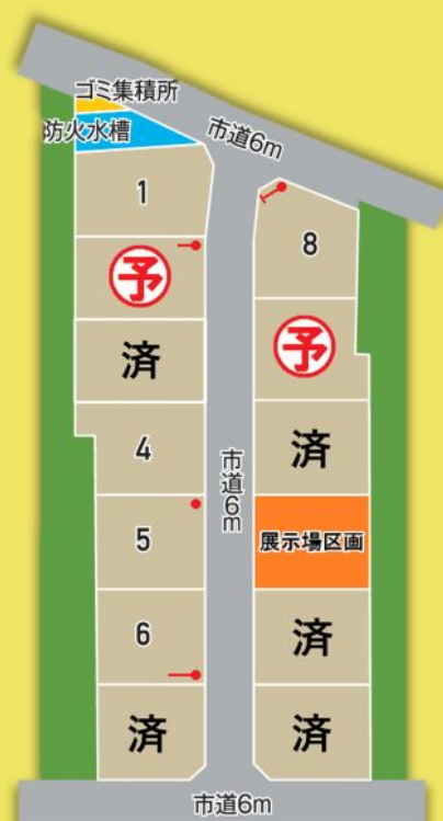
宅地分譲価格表[建築条件付き]