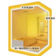
充実した快適な住宅設備をご用意