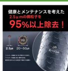
健康換気システム